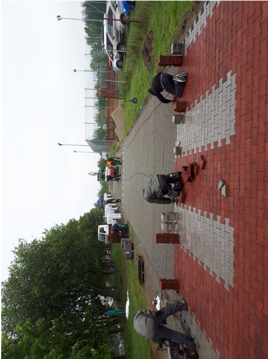
Práce na dráze 100 překážek

Výměna krytiny bude finančně nákladná. Pro tento účel jsme založili sbírkový účet č. 5796256329/0800 a prosíme o finanční pomoc. Současný stav konta činí 135 tis Kč. Díky všem, kteří již přispěli, a to jak na sbírkový účet, účet farnosti nebo hotově. Děkujeme také Obci Senetářov, která opravu podpoří částkou 200 tis. Kč a také Jihomoravskému kraji, který by měl přispět částkou 60 tis. Kč. Dle rozpočtu jsme předpokládali celkové náklady ve výši cca 1 mil. Kč, vysoutěžená smluvní cena činí nyní 849 tis. Kč. Po odkrytí části původní krytiny bude ale kvůli stavu podkladové konstrukce cena